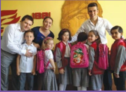
Mutlu Kelebek Kampanyası

Pfizer'in kurumsal sosyal sorumluluk bilincinin temel değerlerinden biri olan 'topluma saygı' ilkesi doğrultusunda kurulan Pfizer Toplum Takımı, 1998'den beri faaliyet gösteriyor.