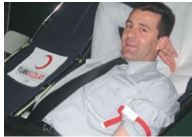
Kan Bağışı Kampanyası