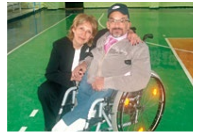
Adana Valiliği ile BEDD Tekerlekli Sandalye Dağıtım Töreni